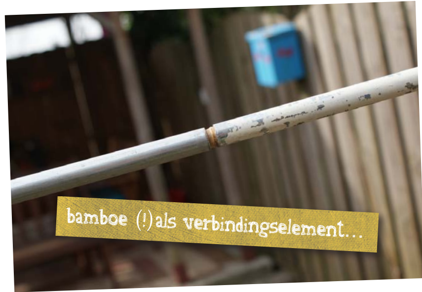
bamboe (!) als verbindingselement...