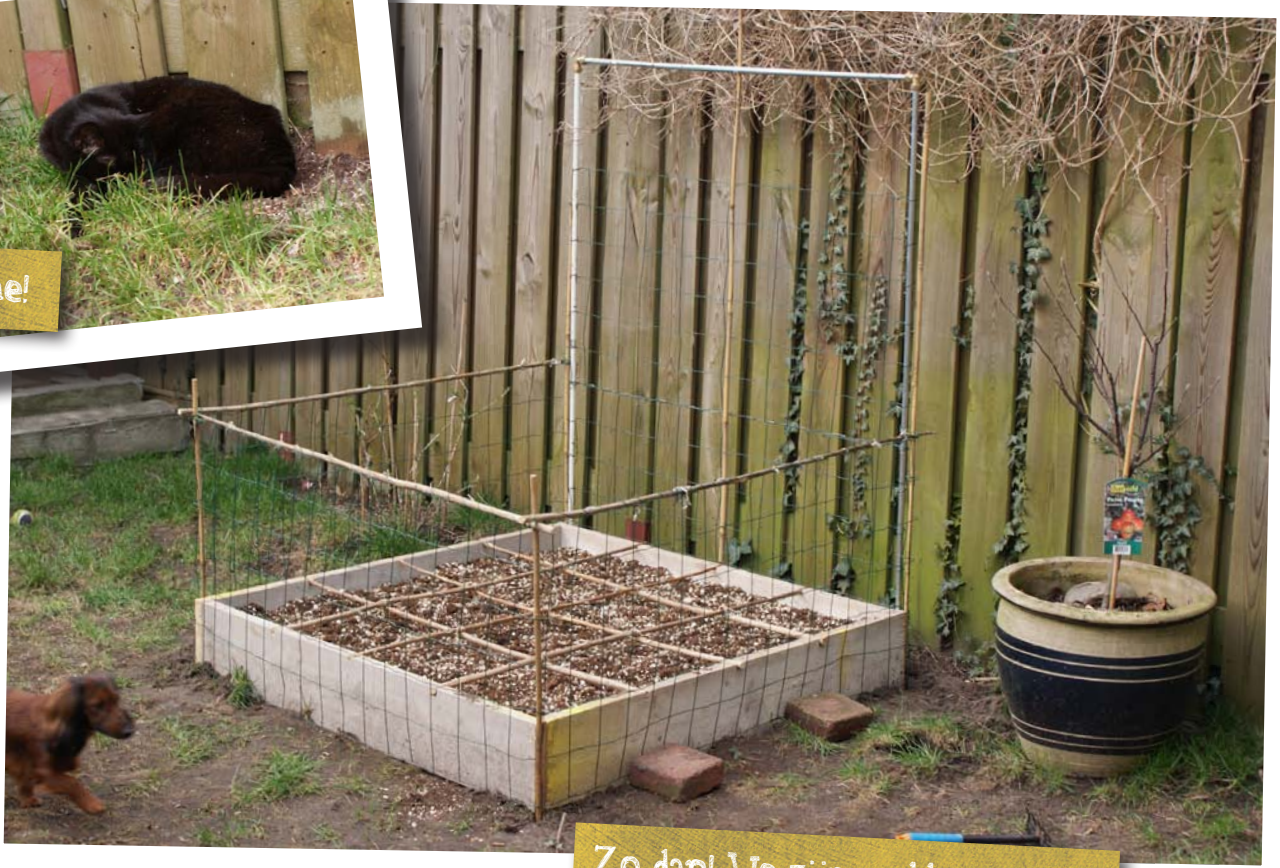
Zo dan! We zijn er klaar voor!