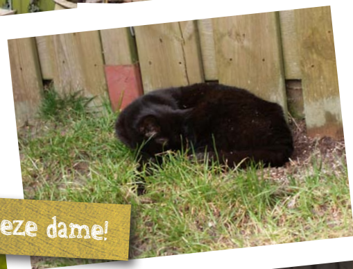
Oh ja, deze dame!