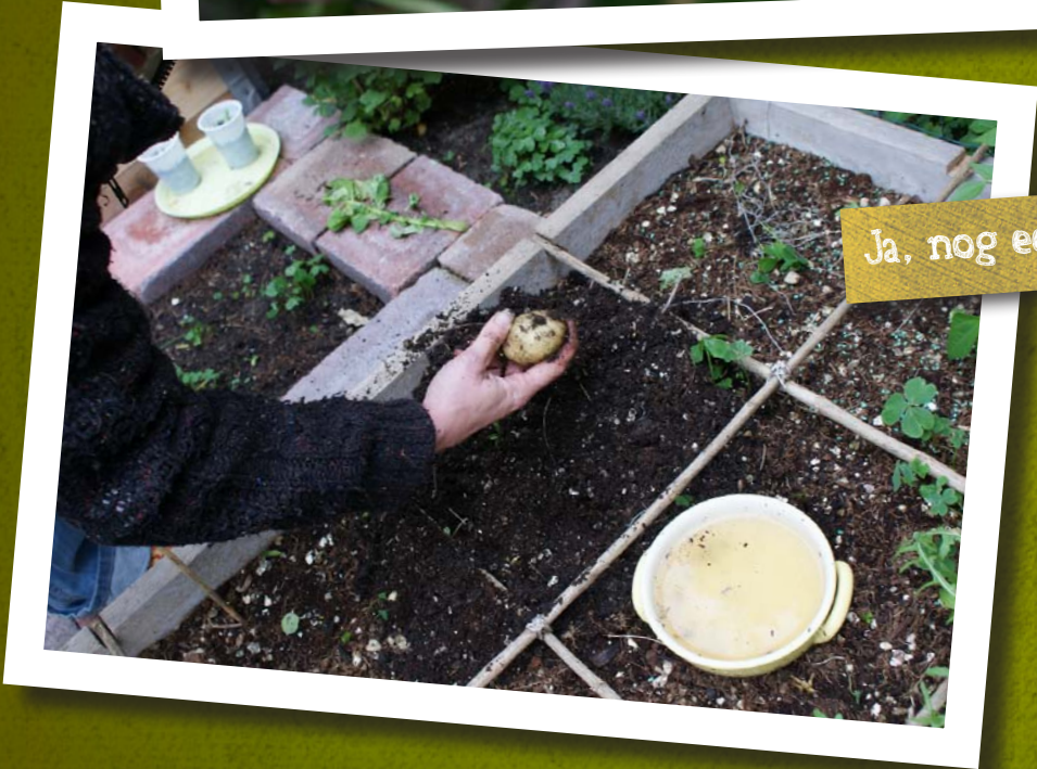
Ja, nog eentje!!