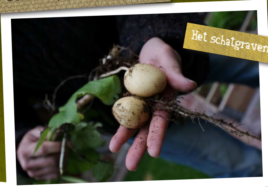
Het schatgraven is begonnen!