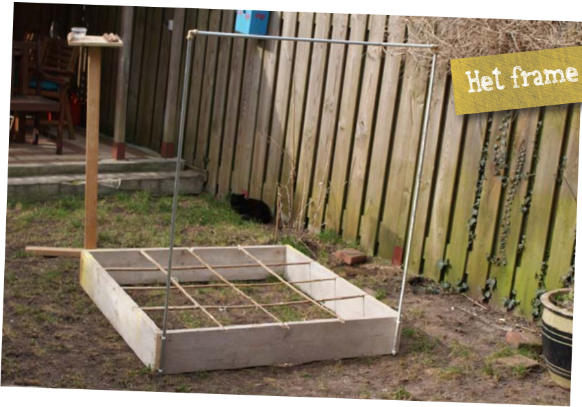
Het frame staat!