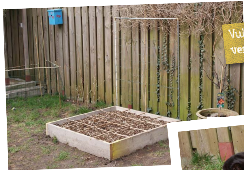
Vullen met compost, turfmoalm en vermiculiet, raster voor de klimmers...